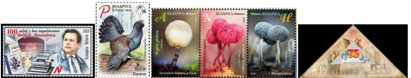
*BIELORRÚSSIA- 06.02.2020, 100 Anos do Nascimento de Andrey Makayonak, 1920-1982 (1 selo).03.03.2020, Ave do Ano – Tetrax-(Perdiz)-grande – “Tetrao urogallus” (1 selo). 06.04.2020, Mixomicetos (3 selos). 30.04.2020, 75 Anos da Vitória na Grande Guerra Patriótica (bloco).