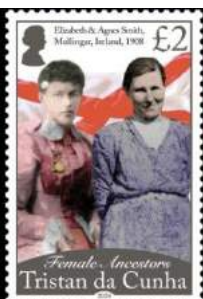
*TRISTÃO DA CUNHA- 07.05.2020, Ancestrais (4 selos).