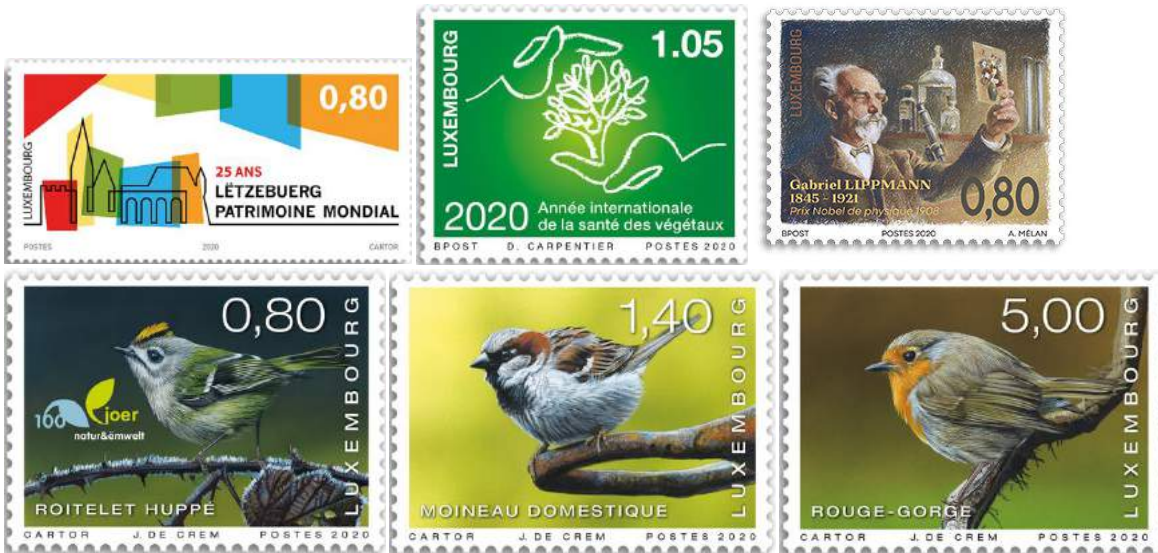
*LUXEMBURGO- 10.03.2020, a) Cidade de Luxemburgo – 25 Anos como Patrimônio Cultural Mundial da Unesco (1 selo); b) 2020 Ano Internacional de Fitossanidade (1 selo); c) 175 Anos do Nascimento de Gabriel Lippman, 1845-1921 (1 selos); d) 100 anos de Natur & Umwelt (1 selo); e) Pássaros raros (2 selos).