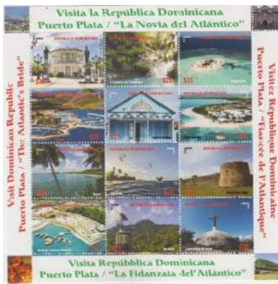
*REPÚBLICA DOMINICANA- 24.01.2020, Série Turística III – Puerto Plata (minifolha). 05.02.2020, 175 Anos da Declaração da Independência Nacional (4 selos; bloco).