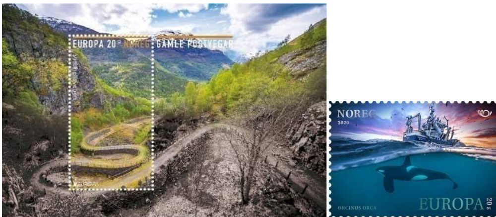
*NORUEGA- 17.04.2020, a) Europa – Antigas Rotas Postais (bloco); b) Série Nórdica – Mamíferos: Orca (1 selo)