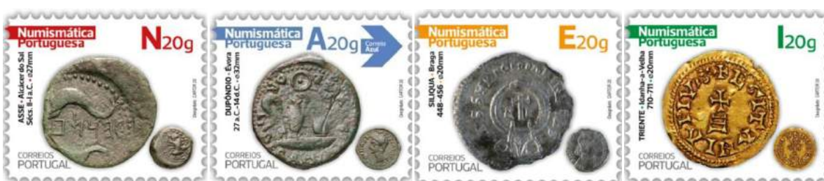
*PORTUGAL- 22.04.2020, Emissão Base - Numismática Portuguesa (4 selos autoadesivos).