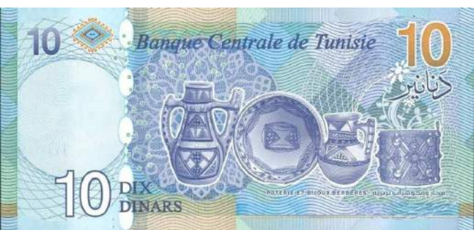
*TUNÍSIA- 30.03.2020, nova cédula de 10 Dinares Tunisiano (TND). Informações- dimensões- 153 mm x 76 mm.