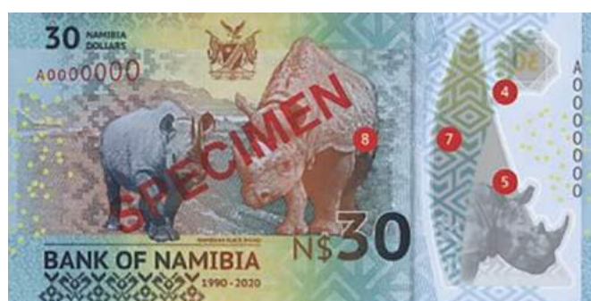
*NAMÍBIA- 2020, cédula comemorativa aos 30 Anos de Independência – valor: 30 Dólares (NAD).