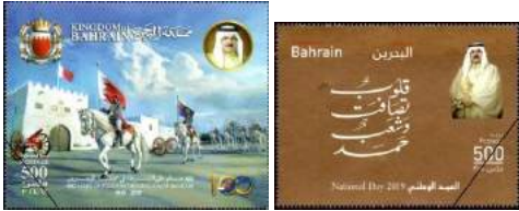
*BAHREIN- 04.12.2019, 100 Anos da Polícia do Reino de Bahrein (1 selo). 16.12.2019, Dia Nacional 2019 (1 selo).