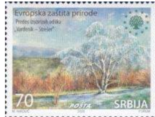
*SÉRVIA- 10.03.2020, Cidades da Sérvia 2020: Kruševac e Čačak (2 selos). 20.03.2020, Proteção Europeia da Natureza (2 selos).