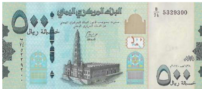
*IÊMEN- 2020, cédula de 500 Rials (YER) com novo assinatura.