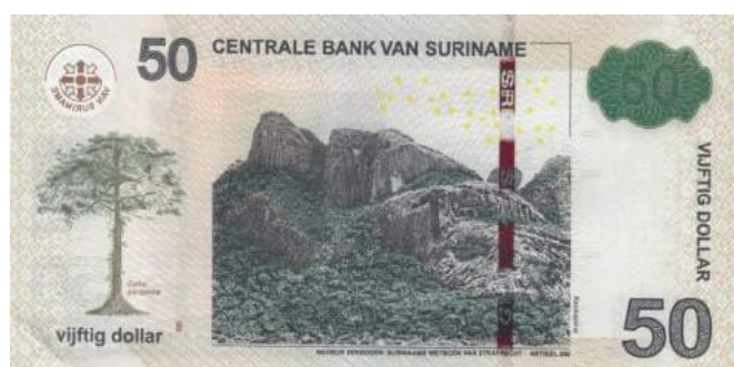
*SURINAME- 01.02.2020, nova cédula de 50 Dólares (SRD).