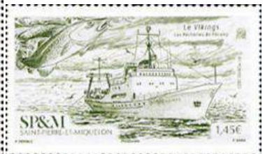
*SÃO PIERRE E MIQUELON- 20.01.2020, Ave limícola (1 selo). 17.02.2020, Concurso de Fotos – “Depois da Tempestade” (1 selo). 11.04.2020, Vila Cotidiana da Antiga Miquelon (4 selos).