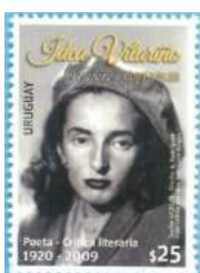
*URUGUAI- 10.03.2020, Mulheres Notáveis – Idea Vilariño, 1920-2009 (1 selo).