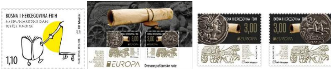
*BÓSNIA E HERZEGOVINA-CORREIO CROATA EM MOSTAR- 02.04.2020, Dia Internacional do Livro Infantil (1 selo). 05.04.2020, Europa – Antigas Rotas Postais (2 selos; bloco).