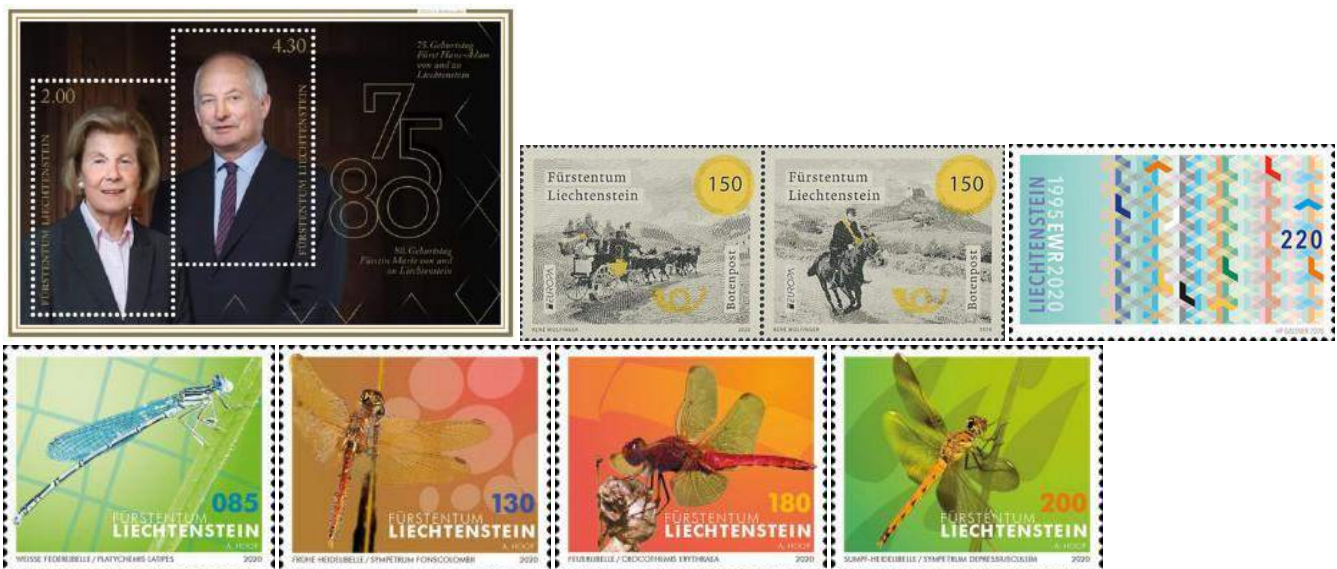
*LIECHTENSTEIN- 02.03.2020, a) 75 Anos do Nascimento do Príncipe Hans-Adam e 80 Anos de Nascimento da Princesa Marie de Liechtenstein (bloco 2 selo); b) Europa – Antigas Rotas Postais (2 selo); c) 25 Anos de Adesão à Área Econômica Europeia – EEA (1 selo); d) Libélulas (4 selos).