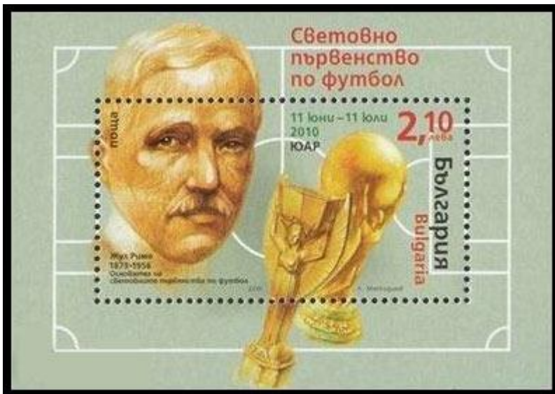
*BULGÁRIA – 11.06.2010, bloco, 2.10 Lev.