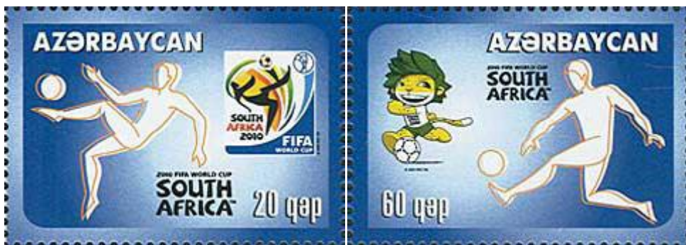
*AZERBAIJÃO – 18.05.2010, 20 e 60 G, apresentando minfolha com 5 se-tenants.