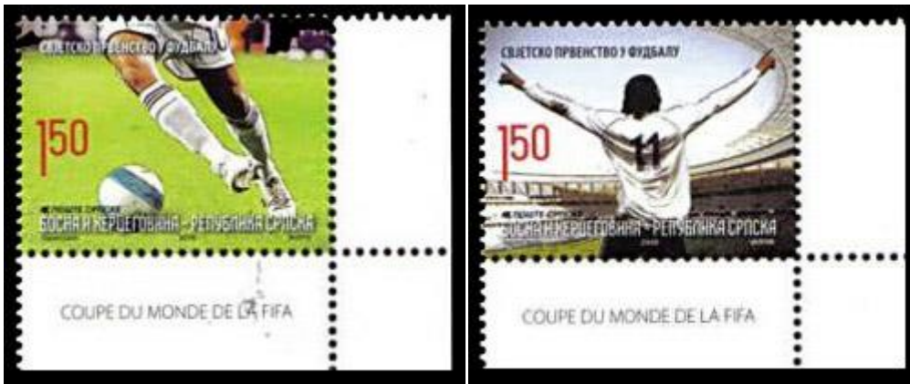
*BÓSNIA-HERZEGOVINA – CORREIO SÉRVIO – 25.05.2010, 2x1.50 BAM.