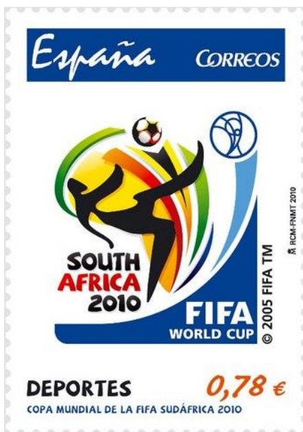
*ESPANHA – 04.06.2010, € 0.78.