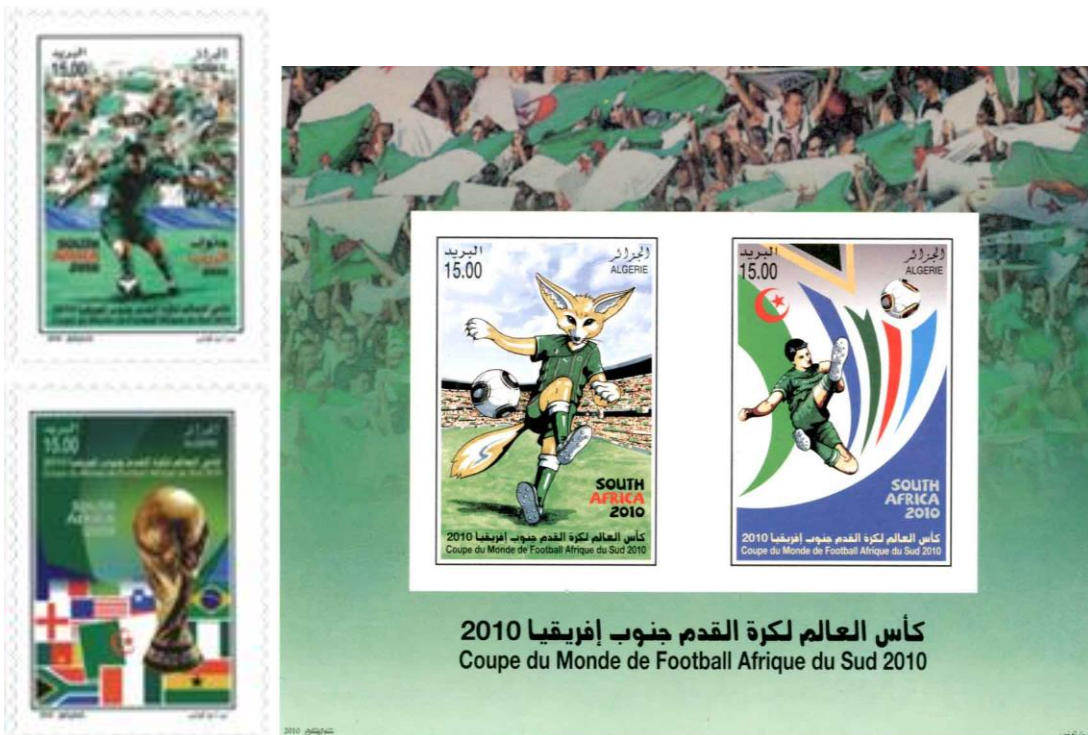
*ARGÉLIA – 08.06.2010, 2x15.00 DA; bloco, 2x15.00 DA.