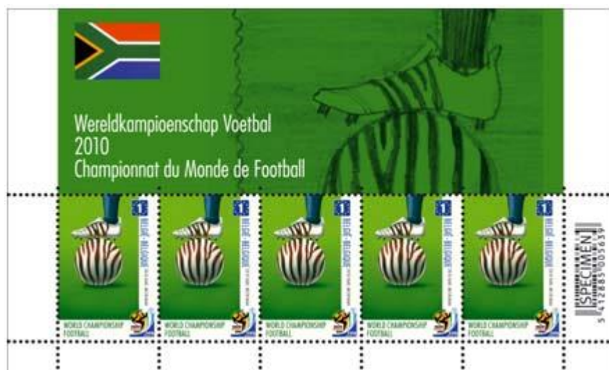
*BÉLGICA – 14.06.2010, € 0.90; minifolha, 5x€ 0.90.