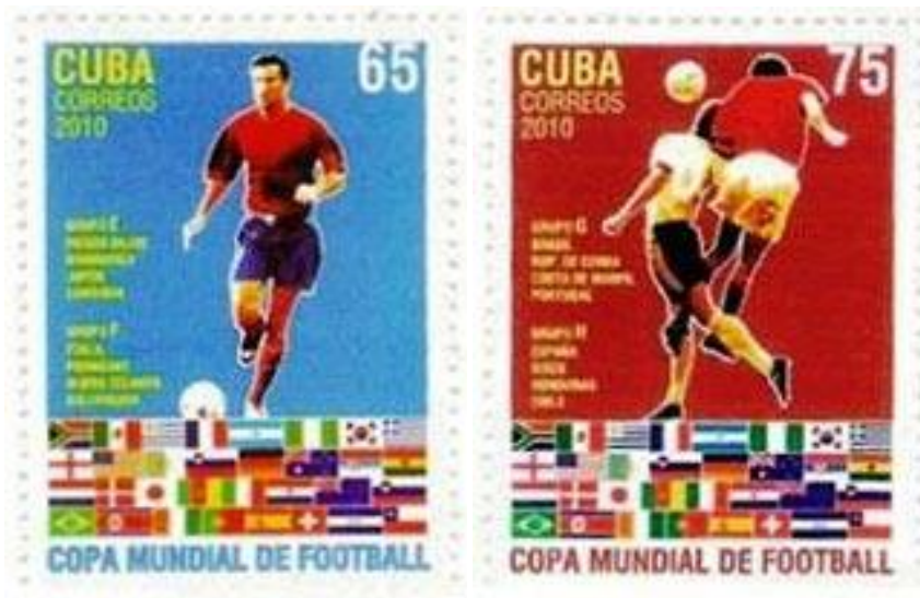
*CUBA – 24.03.2010, 15, 45 65 e 75 Pesos.