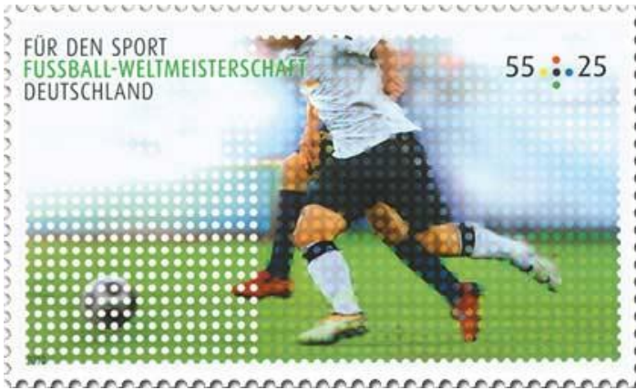
*ALEMANHA – 08.04.2010, €0.55+0.25.