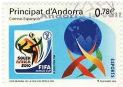
*ANDORRA – CORREIO ESPANHOL – 01.06.2010, € 0.78.