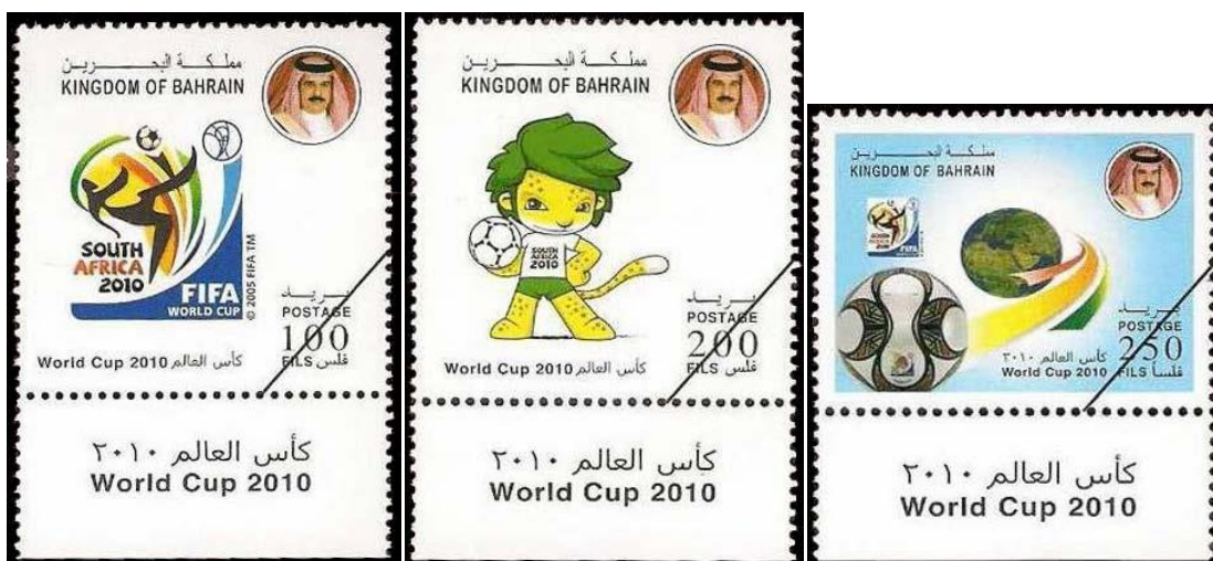
*BAREIN – 2010, 100, 200 e 250 Fils.