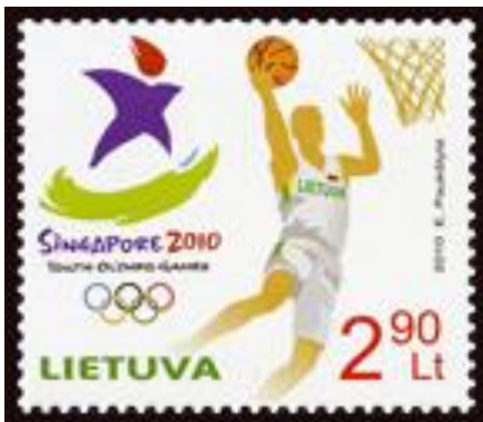
*LITUÂNIA – 31.07.2010, Jogos Olímpicos da Juventude SINGAPORE 2010 (2,90 Lt).