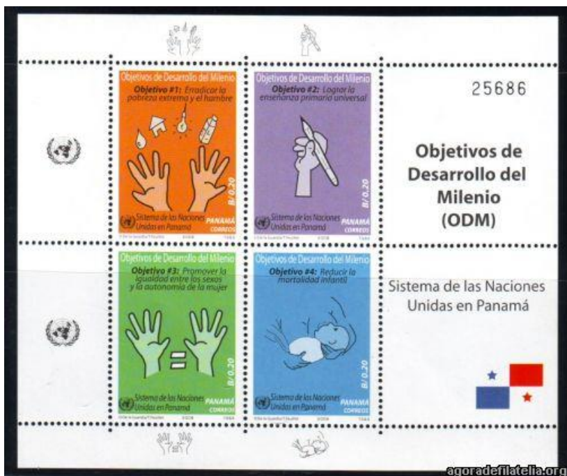
*PANAMÁ – 18.08.2010, ONU – Objetivos do Desenvolvimento do Milênio (minifolha, 4xB/0.20).