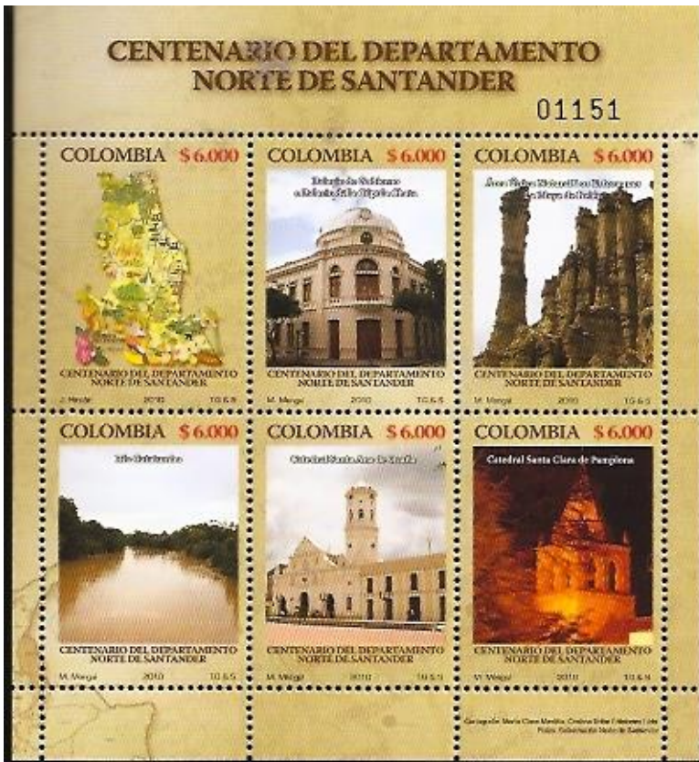
* COLÔMBIA – 14.07.2010, Centenário do Departamento Norte de Santander (bloco, 6x$6.000).