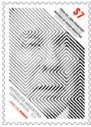
* ARGENTINA – 14.08.2010, Feira do Livro Frankfurt 2010 – Argentina, Convidada de Honra ($7.00).