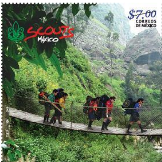
*MÉXICO – 17.07.2010, Scouts México – Escoteiros México ($7.00).