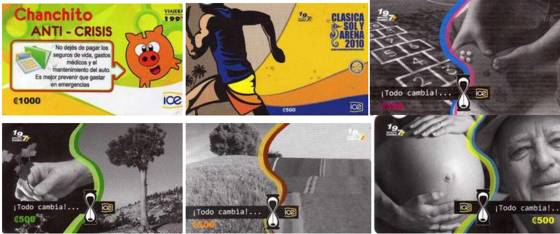
*COSTA RICA – ICE, 02/2010 Chanchito Anti-Crise (1000 Colones. 02/2010, Clásica Sol e Areia 2010 (500 Colones). 03/2010, Tudo Muda – 4 Cts. (500 Colones cada).