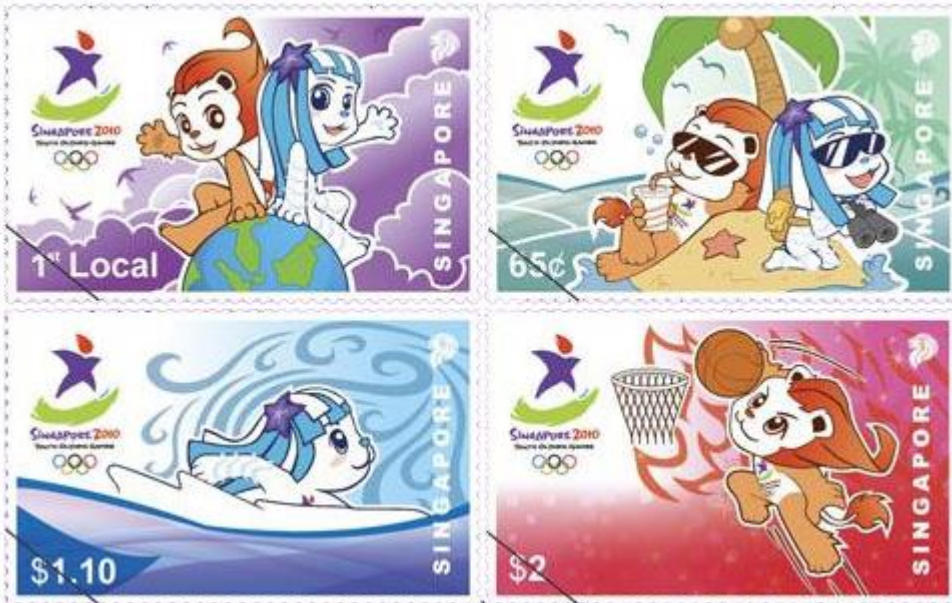
* CINGAPURA – 14.08.2010, Jogos Olímpicos da Juventude SINGAPORE 2010 (1º Porte Interno, 65c, $1.10 e $2.00).