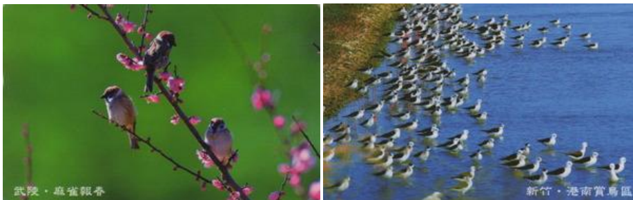
*TAIWAN – Chunghwa Telecom, 2010, Aves de Taiwan, tiragem: 200.000 séries (100 e 200 unidades).