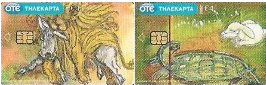
*GRÉCIA – OTE, 04/2010, Fábulas de Esopo (2 x €4.00).