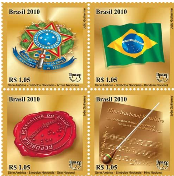
07.09.2010, Série América - Símbolos Nacionais (4xR$ 1,05).