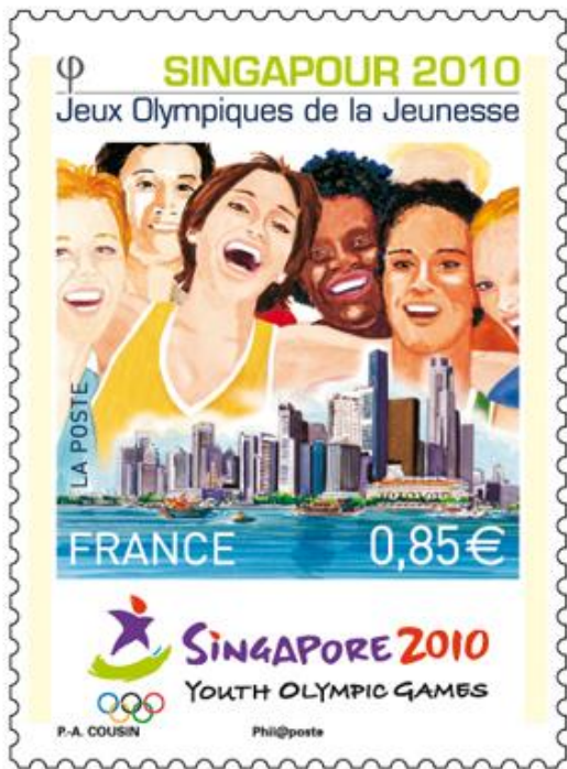
*FRANÇA – 16.06.2010, Jogos Olímpicos da Juventude SINGAPORE 2010 (€ 0.85).