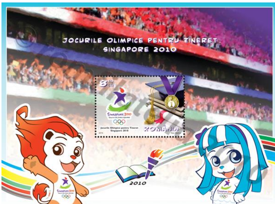
*ROMÂNIA – 12.08.2010, Jogos Olímpicos da Juventude SINGAPORE 2010 (8.10 Lei).