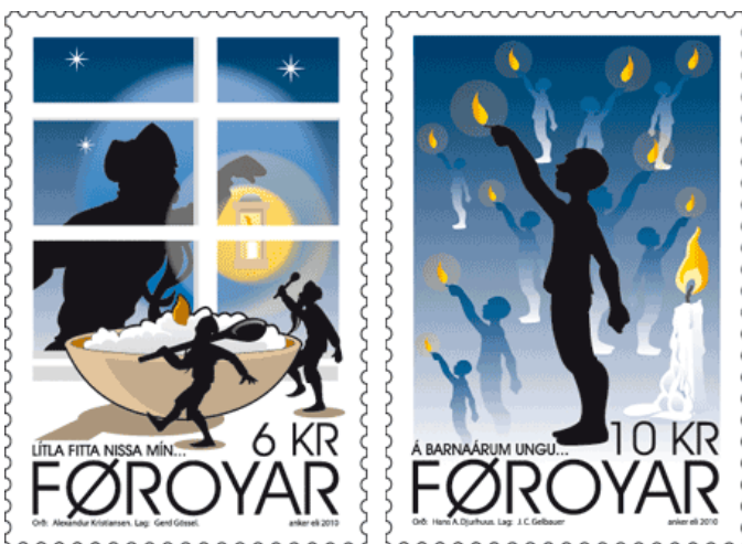
* FAROE – 20.09.2010, Cânticos Natalinos (DKK 6.00 e 10.00).