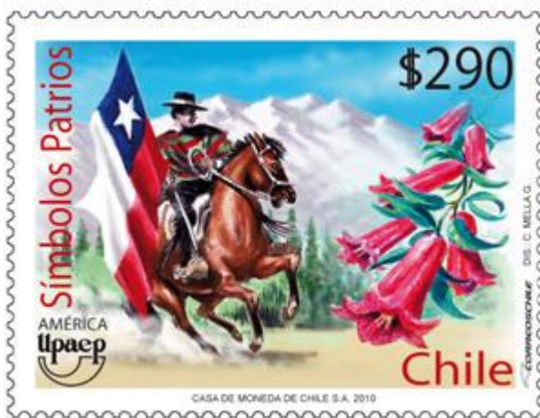
* CHILE - 12.10.2010, América UPAEP – Símbolos Pátrios ($290).