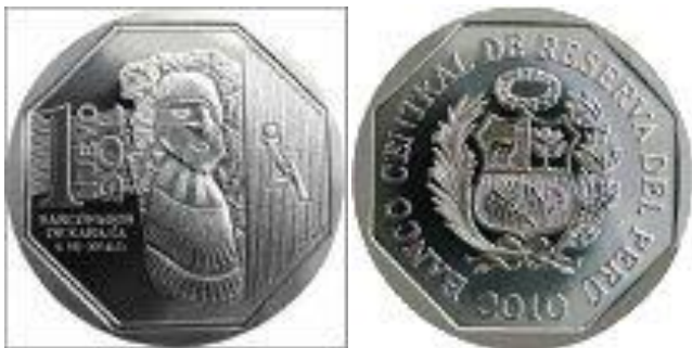
*PERU – 2010, Sarcófagos de Karajía – moeda de 1 S/. – Novo Sol Peruano; peso: 17,5g; diâmetro: 23,5mm; produção: 10.000 peças.