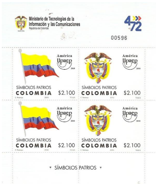
*COLÔMBIA- 12.10.2010, América UPAEP 2010: Símbolos Pátrios (bloco, 4x$2.100).