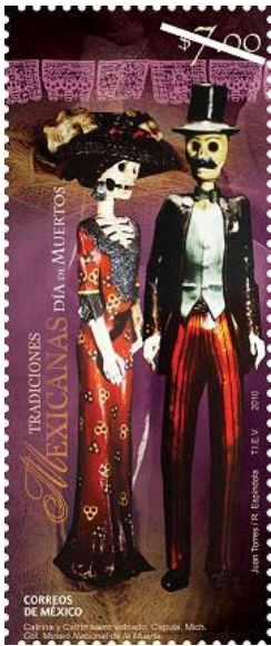
*MÉXICO- 25.10.2010, Tradições Mexicanas “Dia dos Mortos” ($7.00).