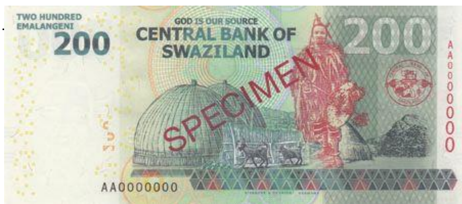
*SUAZILÂNDIA – 2010, Novas cédulas de 100 Emalangeni (US$14.70) e 200 Emalangeni (US$ 29.40).