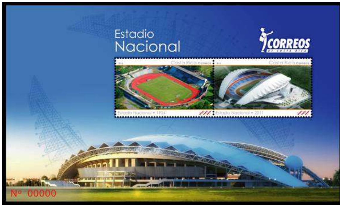
*COSTA RICA- 26.03.2011, Estádío Nacional (bloco, 1.000 colones).