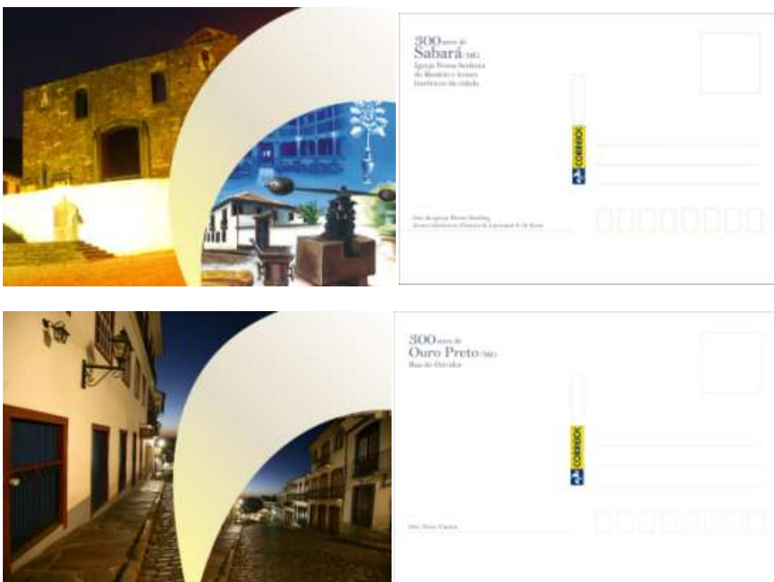
Cartões Postais da Série Cidades Históricas emitidos pelos Correios: Sabará e Ouro Preto.

Dia 24/08 - Série Relações Diplomáticas – Brasil-Ucrânia.