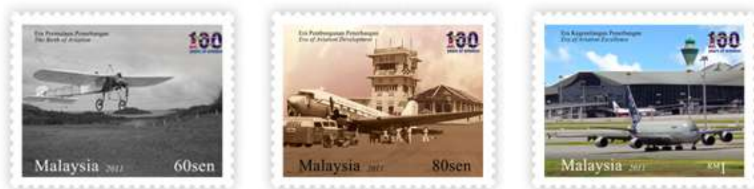
*MALÁSIA- 07.07.2011, 100 Anos da Aviação (60 Sen, 80 Sen e RM1).