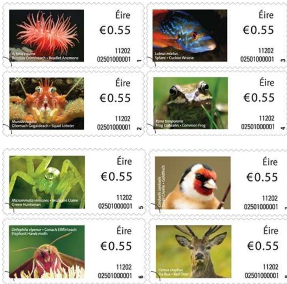
*IRLANDA- 21.07.2011, Vida Marinha e Animais Irlandeses (8x55c).