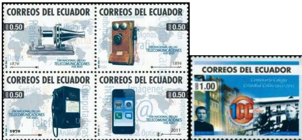
*EQUADOR- 07.07.2011, Centenário do Colégio Cristóbal Colón (Cristóvão Colombo), Guayaquil ($1.00). 08.07.2011, Dia Nacional das Telecomunicações (4 x $0.50).