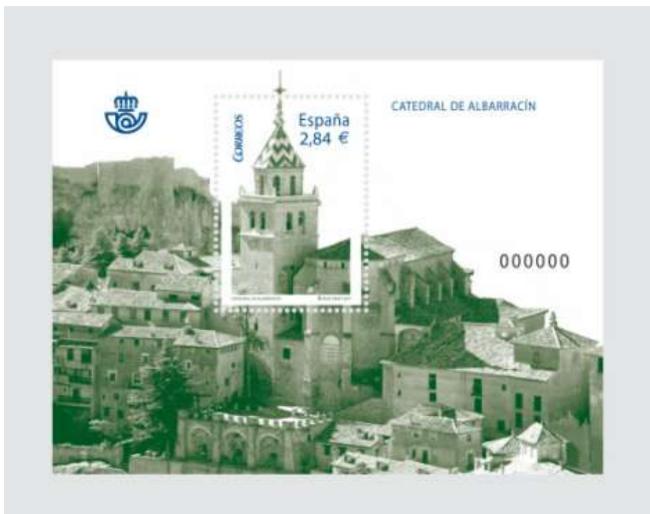
*ESPAÑA- 01.07.2011, Dia Mundial da Juventude (0,80€). 15.07.2011, Série Catedrais – Catedral de Albarracín (2.84€). 22.07.2011, Cinema Espanhol: Luís García Berlanga e Rafael Azcona (2 x 0.80€).