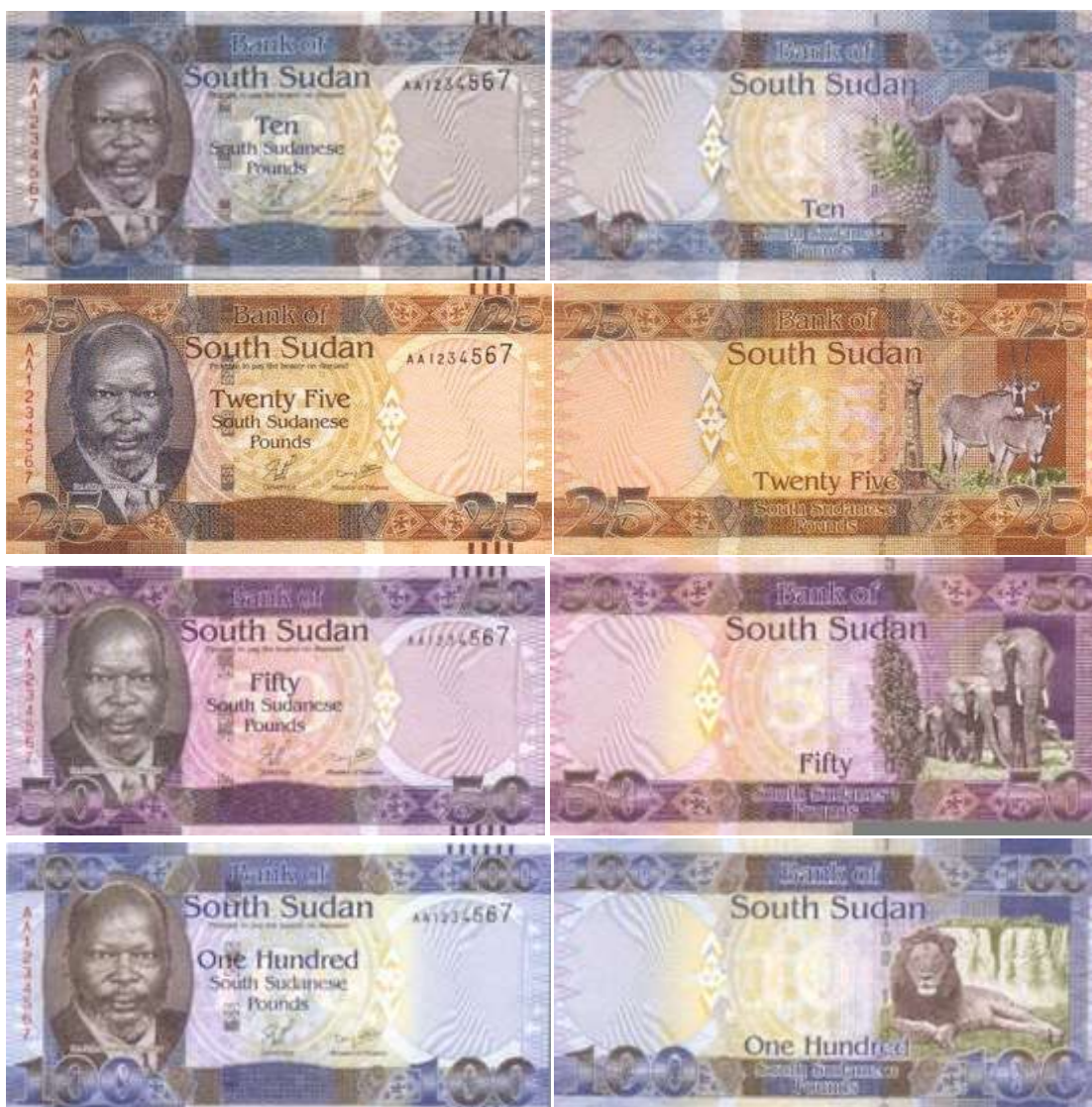
*SUDÃO DO SUL- 18.07.2011, Primeiras cédulas do novo país africano: 10, 25, 50 e 100 Libras Sudanesas do Sul.