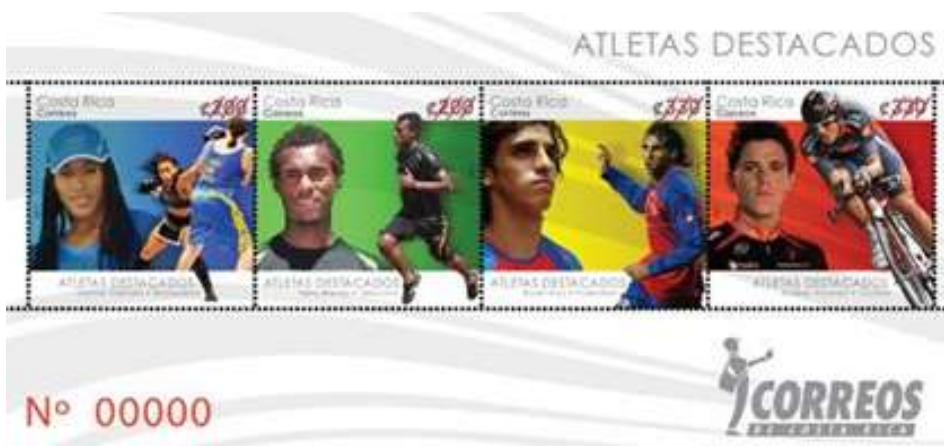
*COSTA RICA- 2011, Atletas Destacados: boxeadora Hanna Gabriels, corredor Nery Brenes, jogador de futebol Bryan Ruiz e ciclista Andrey Amador (2 x C200 e 2 x C330).