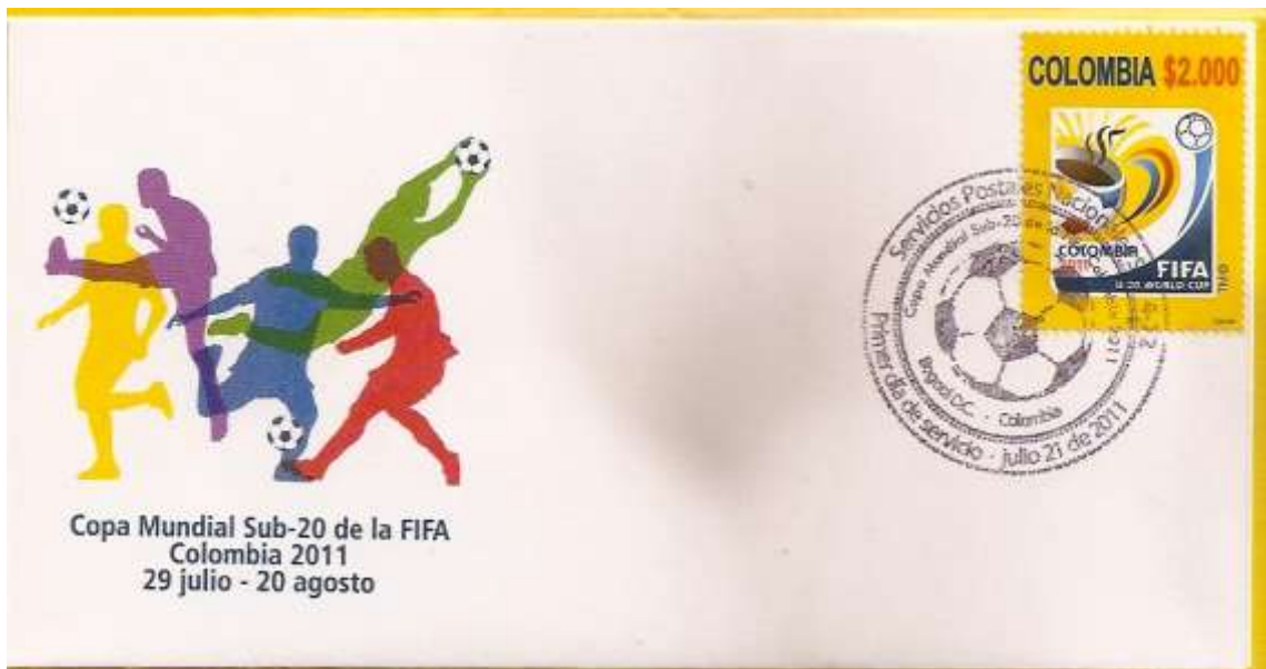
*COLÔMBIA- 21.07.2011, Copa Mundial Sub-20 da FIFA Colombia 2011 ($2.000).