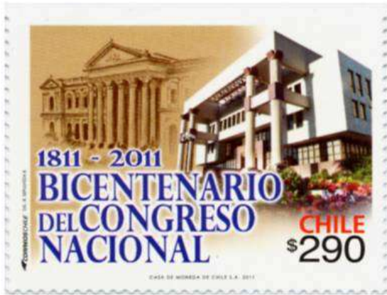
*CHILE- 03.07.2011, Bicentenário do Congresso Nacional ($290).