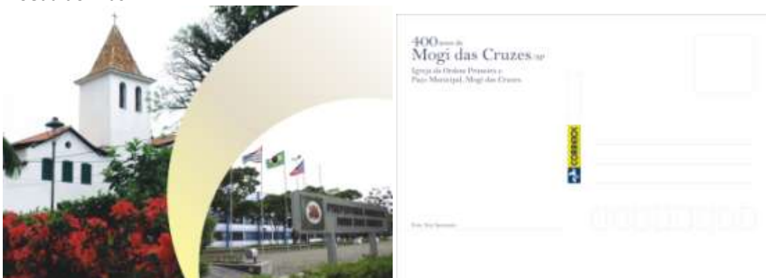
* Postal da emissão 400 Anos de Mogi das Cruzes/SP.

12.09.2011, Centenário do Theatro Municipal de São Paulo. Edital nº 20; arte: Juliana Souza; processo de impressão: ofsete; apresentação: folha com 24 selos; papel: cuchê gomado; valor facial: R$2,00; tiragem: 600.000 selos; área de desenho: 54mm x 20mm; dimensões do selo: 59mm x 25mm; picotagem: 12 x 11,5; local de lançamento: São Paulo/SP; impressão: Casa da Moeda do Brasil.