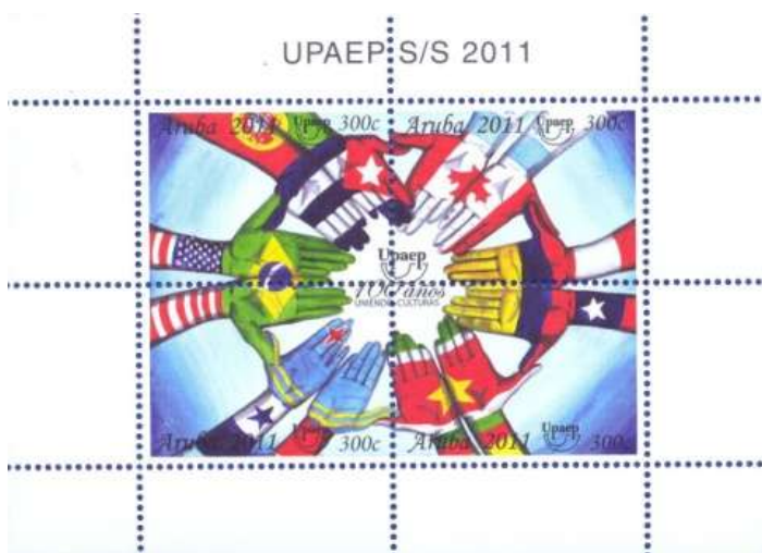
*ARUBA- 2011, 100 Anos da UPAEP (4 x 300c).