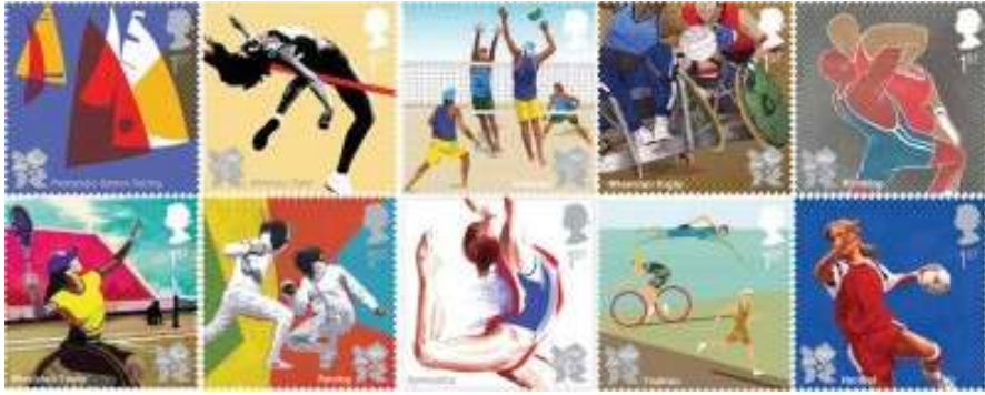
*GRÃ-BRETANHA- 27.07.2011, Jogos Olímpicos e Paraolímpicos 2012 III (10 x 1º Porte).