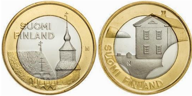
* FINLÂNDIA - 2013, Prédios Provinciais: Tavastia e Ostrobothmia – moedas de EUR 5 – composição: centro – CuNi e anel: Ouro Nórdico. Diâmetro: 27,25mm; pesos: 9,80g.