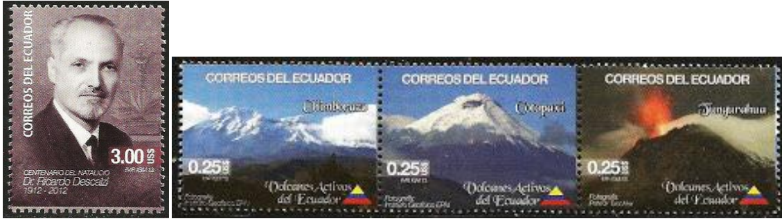
*EQUADOR- 01.08.2013, 100 ANOS DO NASCIMENTO DO MÉDICO, LITERATO E HISTORIADOR Ricardo Descalzi ($3.00). 21.08.2013, Vulcões ativos do Equador (3 x $0.25).