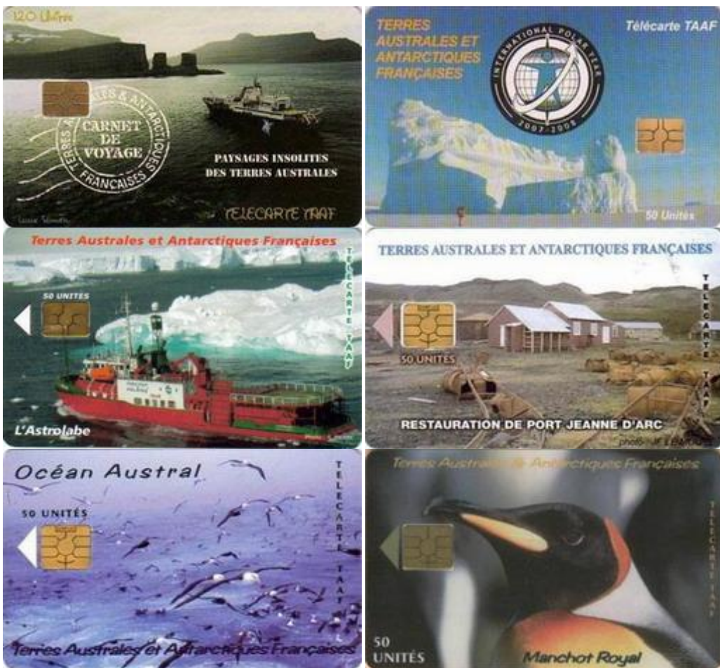
*TERRAS AUSTRAIS E ANTÁRTICAS FRANCESAS (TAAF) - Cartões Telefônicos de diversas datas e temas.