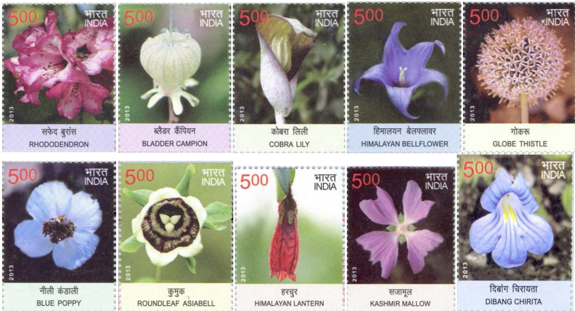
*ÍNDIA- 03.09.2013, Flores Silvestres (10 x 500p; minifolha).