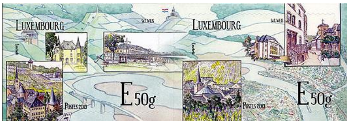
*LUXEMBURGO- 24.09.2013, Vale de Moselle (2 x porte E50g).