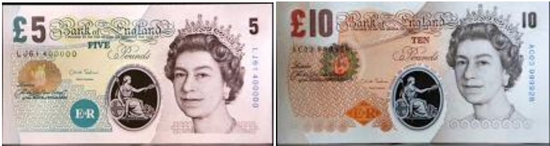
GRÃ-BRETANHA , cédulas que serão lançadas pelo Banco da Inglaterra em 2016.