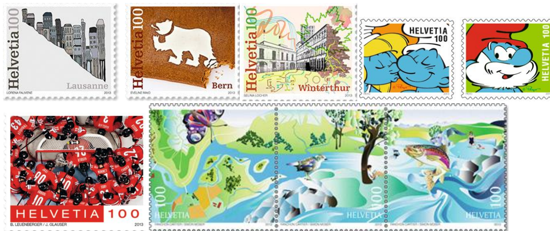
*SUIÇA- 05.09.2013, a) Cidades da Suíça (3 x 1.00 CHF); b) Os Smurfs (2 x 1.00 CHF); c) Campeonato Mundial de Hóquei no Gelo (1.00 CHF); d) Restauração (3 x 1.00 CHF).