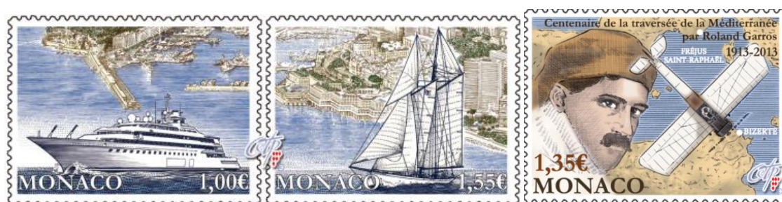
*MÔNACO- 23.09.2013, a) latismo (€1.00 e €1.55); b) 100 anos da primeira travessia aérea do Mediterrâneo por Roland Garros (€1.35).