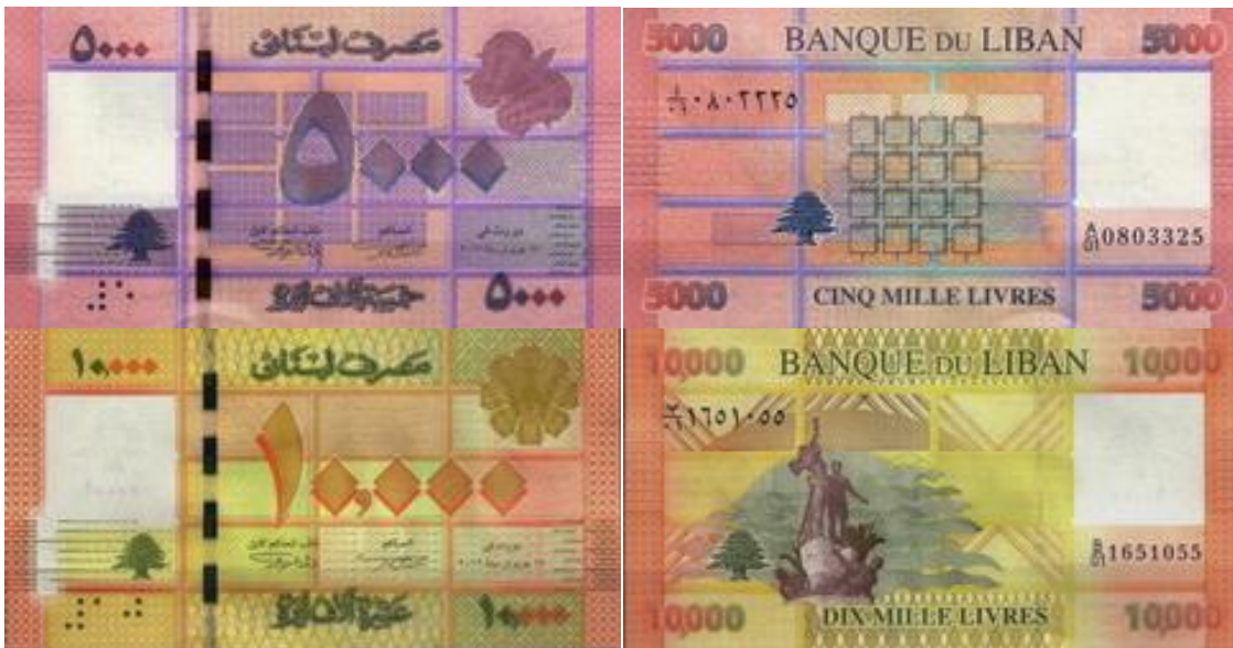
* LÍBANO - 2013, cédulas de 5.000 e 10.000 Libras.