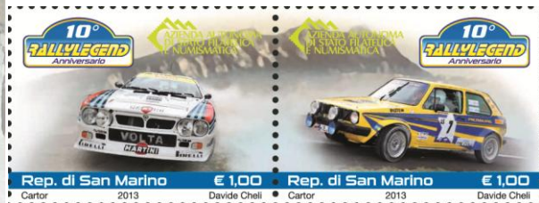
*SAN MARINO- 09.10.2013, a) Natal 2013 (bloco, 3 x €0.70); b) Lendas do Rallye ( 2 x €1.00).