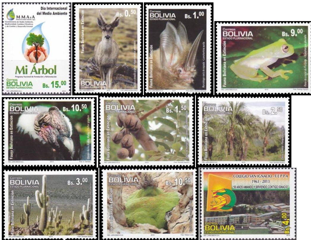
* BOLÍVIA - 09.07.2013, a)Dia Internacional do Meio Ambiente (Bs. 15.00); b) Fauna Boliviana em Perigo de Extinção (Bs. 0.50, 1.00, 9.00 e 10.50); c) Flora Boliviana em Perigo de Extinção (Bs. 1.50, 2.50, 3.00 e 10.50). 25.07.2013, 50 anos do Colegio San Ignacio FEPPA. (Bs. 4.00).

Hermann Blumenau, e ícones da cidade por ele fundada, a Ponte de Ferro e uma construção em estilo enxaimel; Cultura pelo dramaturgo Bertolt Brecht, que influenciou textos e montagens teatrais nacionais. No fundo de cada selo, há um painel de microletras com a inscrição “Alemanha + Brasil”. Foram utilizadas as técnicas de desenho e computação gráfica.