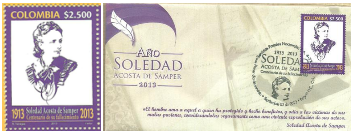
* COLÔMBIA - 03.09.2013, 100 anos do Falecimento de Soledad Acosta de Samper ($2.500).