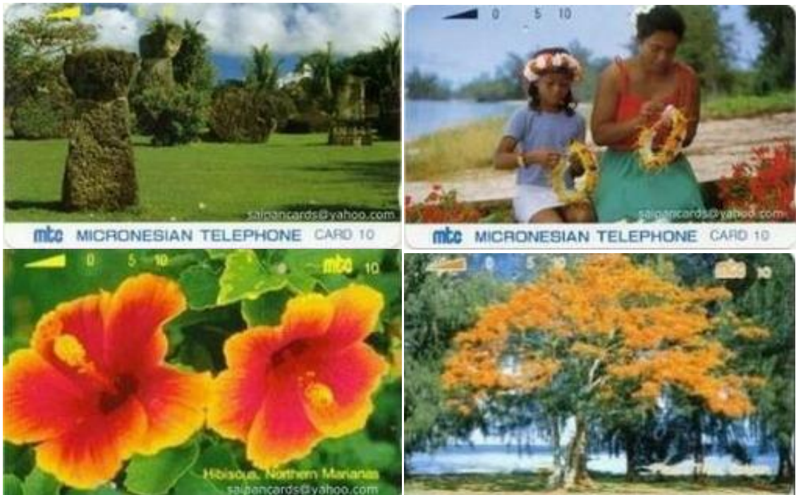
*ILHAS MARIANAS (MICRONÉSIA) – Cartões Telefônicos de diversas datas e temas.