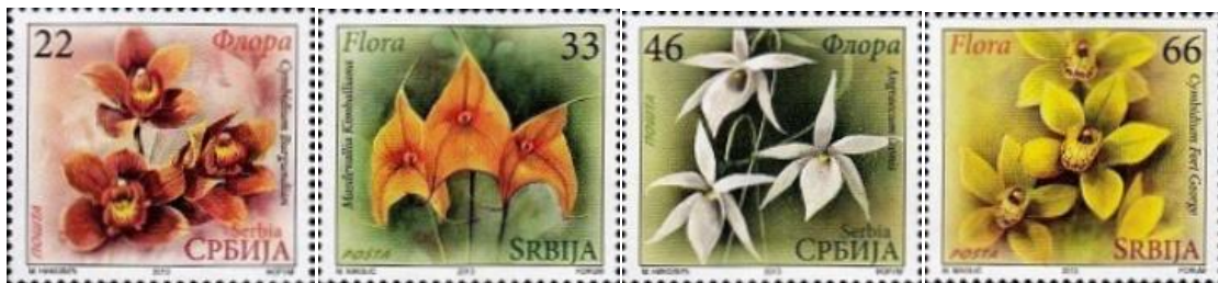
*SÉRVIA- 14.06.2013, Flora – Orquídeas (22, 33, 46 e 66 Din).