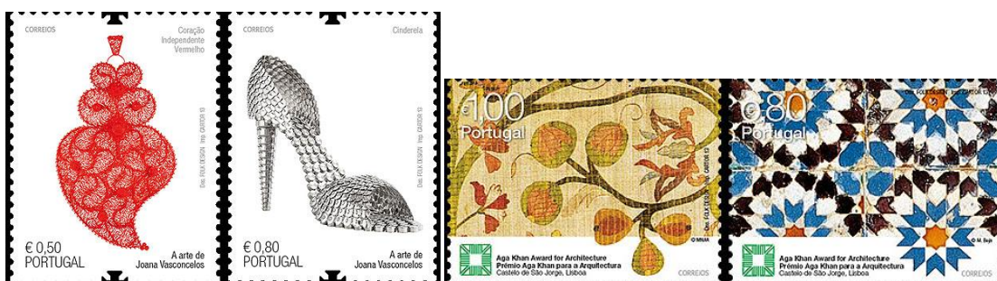
*PORTUGAL- 16.09.2013, A Arte de Joana Vasconcelos (€0.50 e €0.80). 10.09.2013, Prémio Aga Khan para a Arquitetura – Castelo de São Jorge, Lisboa (€0.80 e €1.00).