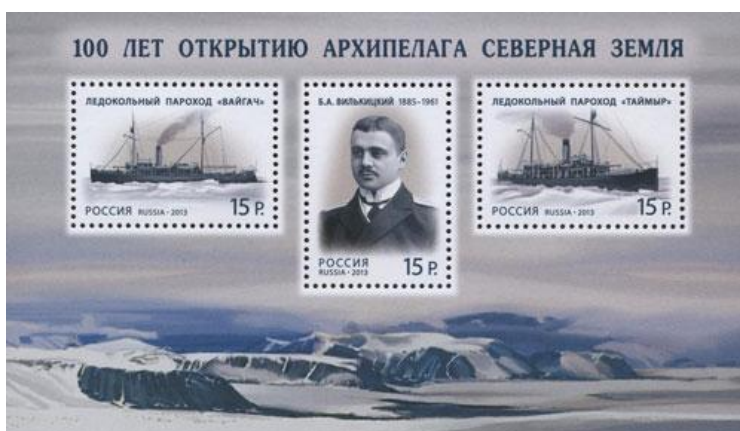
RÚSSIA- 04.09.2013, 100 anos da descoberta do Arquipélago Severnaya Zemlya (bloco, 3 x 15 Rb).