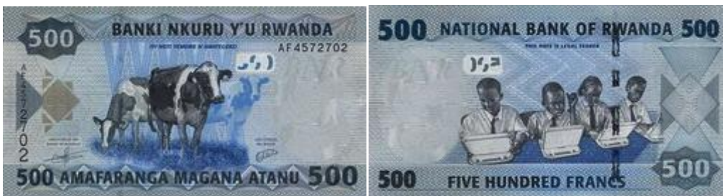
* RUANDA - 2013, cédula de 500 Francos – frente: vacas de raça em uma fazenda; verso: estudantes com seus computadores.