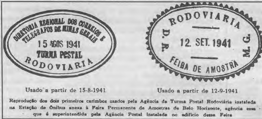
Reprodução dos dois primeiros carimbos usados pela Agência da Turma Postal Rodoviária instalada na Estação de Ônibus anexa à Feira Permanente de Amostras de Belo Horizonte, agência essa que é superintendida pela Agência Postal instalada no edifício dessa Feira

Reproduzindo os desenhos dos dois primeiros carimbos usados pelos correios nacionais –