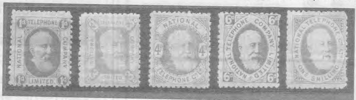
Série da Inglaterra

J.Marques Barboza- RBandeirantes, 154/82- C a m b u i - 1 3 0 2 4 - 010=Campinas=SP-Bra- sil (019) 3255-1600 jmarboza@aleph.com.br