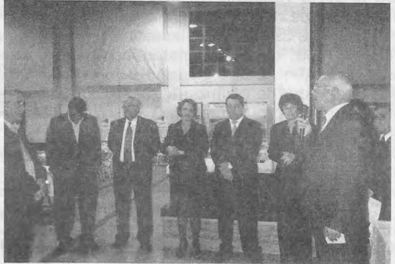
Solenidade de abertura da Exposição Filatélica Centenário de Cruzeiro.