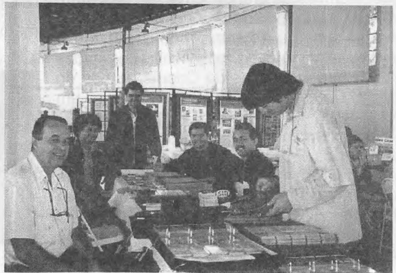
1º Encontro de Colecionadores em Cruzeiro Grupo de Participantes