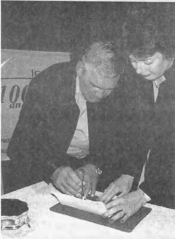
Prefeito de Cruzeiro, Professor Celso de Almeida Lage, no lançamento do Carimbo Comemorativo.